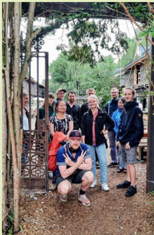
Fællesbillede af deltagerne på rundvisningen.