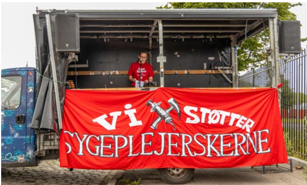
BJMF støtter sygeplejerskerne, som her ved et frokostmøde på Amager foran en af de store kommunale arbejdspladser, hvor sygeplejersker og kommunefolk mødte hinanden.

Hold øje med Facebook og andre medier, og deltag i de annoncerede aktiviteter. ■