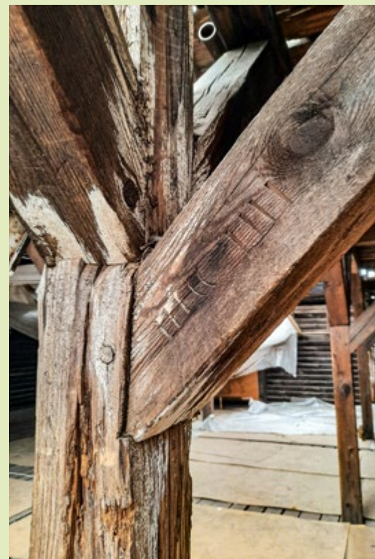
Dragere med skræstivere: I samlingerne er tapperne navlet i og skræstiverne er nummereret med romertal.