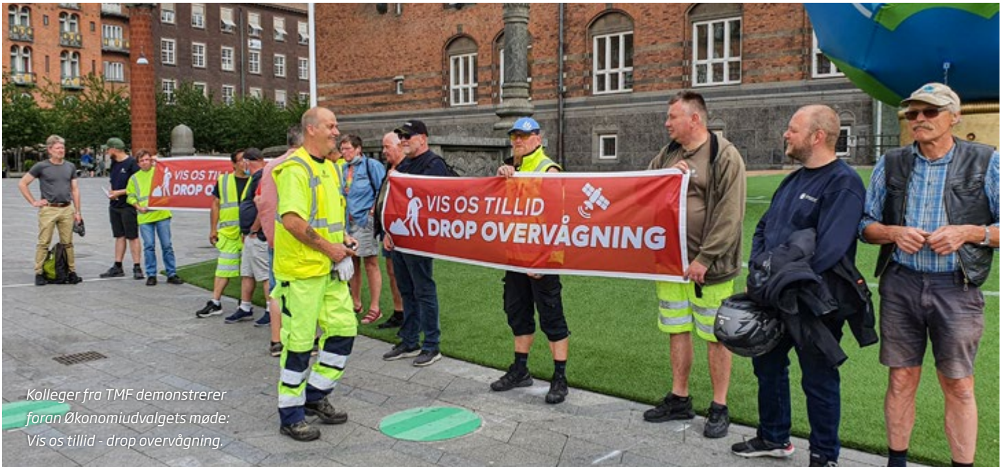
Kolleger fra TMF demonstrerer foran Økonomiudvalgets møde: Vis os tillid - drop overvågning.