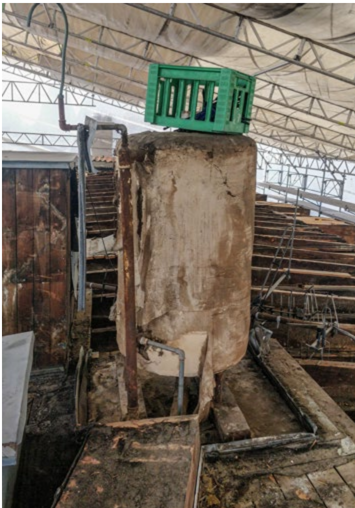
En gammel ekspansionsbeholder i kiselgur fik asbestalarmen til at ringe hos et tømrersjak. Og ikke uden grund, viste det sig.

Nu kunne vi godt begynde at mærke en spirende frustration fra byggeledelsens side, og vi var bestemt heller ikke tilfredse med